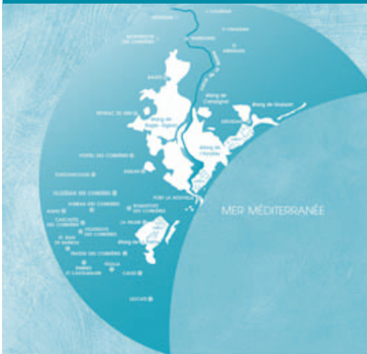
Secteur du programme LIFE EDEN

* Il s'agit ici d'une synthèse des premiers résultats d'un audit dont le rapport final sera communiqué en fin de programme.