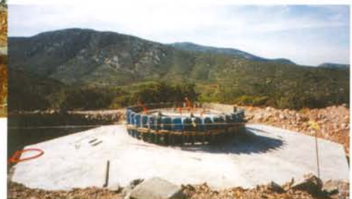
Chantier éolien du Souleilla à Treilles : massif de fondation d'une éolienne BONUS de 1,3 MW.

► Le nettoyage de la bétonnière est effectué en dehors du site.