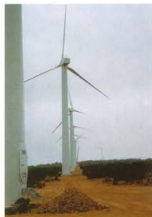
Les fondations de l'éolienne n'émergent pas du sol.

► Tous les déblais excédentaires ont été évacués (merlons de terre éventuels, graviers, sables et autres matériaux apportés, souches et bois morts issus du débroussaillage et de l'élagage).