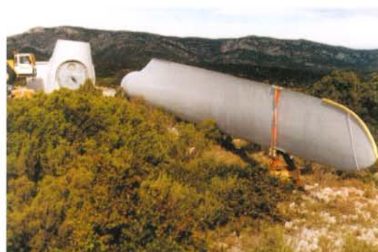
Assemblage du rotor d'une éolienne BONUS de 1,3 MW (diamètre de 62m), la pale mesure 29 m; le décapage de la végétation sur la longueur des pales n'a pas été nécessaire (chantier éolien du Souleilla à Treilles).