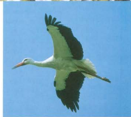
Le site se trouve dans un couloir migratoire important (cigognes, grues cendrées, rapaces...)