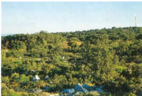
Le site de Garrigue Haute est un plateau.