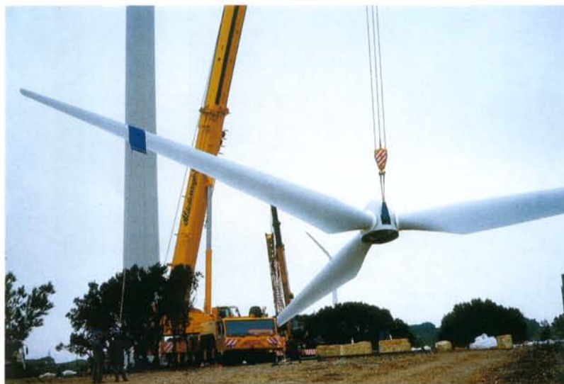
Les emplacements de grues pour le levage du rotor ont été effectués de manière à préserver les cépées de chênes verts (Chantier éolien de Garrigue Haute à Sigean).

► L'assemblage du rotor au sol peut se faire en jouant avec les zones de faible densité de végétation, réduisant ainsi les surfaces à décapper.