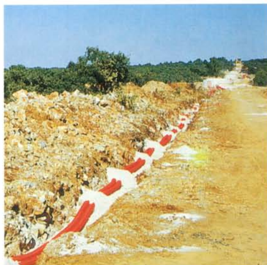
Le raccordement électrique longe la piste. Les tranchées font environ 80 cm de large.