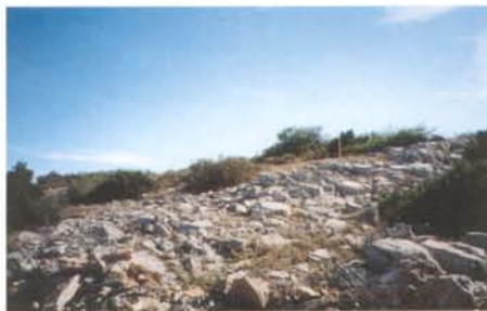
Afin de préserver cette barre rocheuse, le piquetage initial de la piste a été modifié pour la contourner.