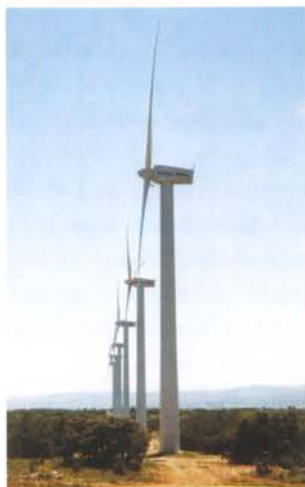
Le poste de livraison est invisible depuis l'accès principal au site de Sigean. Cela est dû à la conservation de la végétation et à l'alignement du poste de livraison avec les éoliennes.