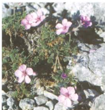
L' Erodium fétide est une espèce dont la présence est limitée aux zones rocailleuses les plus arides de la région.

Les pelouses sèches à Brachypode rameux (graminée) sont des milieux ouverts d'une grande richesse floristique (orchidées et autres bulbeuses notamment). Entretien par l'homme (feu), elles constituaient autrefois les lieux de pâturage des moutons, le pastoralisme étant alors le principal moteur de l'économie rurale.