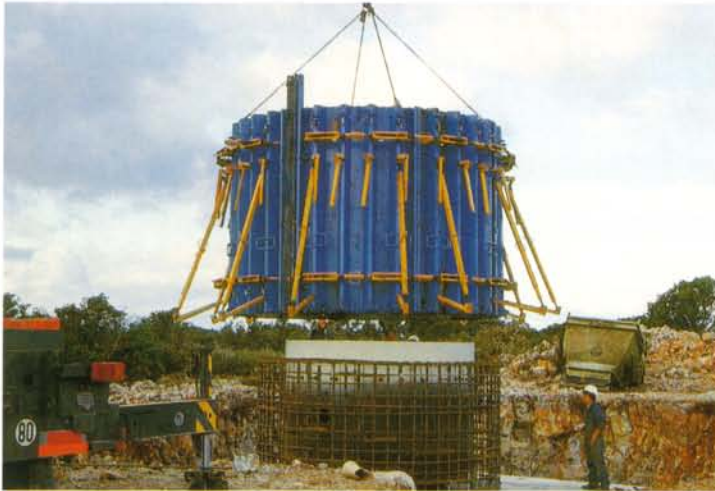
Chantier éolien de Garrigue Haute à Sigean : sur la semelle en béton (1 m d'épaisseur), réalisation du fût de 4 m de diamètre pour les fondations d'une éolienne VESTAS de 660 kW.

Un repérage botanique, en concertation avec les services de l'Etat et réalisé sur le site en amont des travaux de débroussaillage, a permis de préciser les espèces et les individus à préserver. Les végétaux issus du débroussaillage ont été girobroyés finement, ce qui favorise leur décomposition.