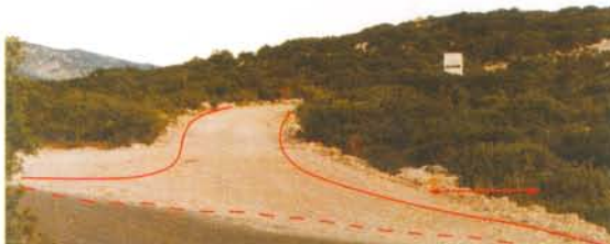
Principe de réduction de l'emprise de la piste d'accès aux éoliennes du Souleilla depuis la départementale D227. D'un point de vue visuel, le respect de la hiérarchie "route plus large que la piste" est important pour la préservation du site.