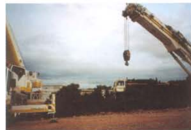
A un croisement de pistes assez dégagé, la conservation d'un écran de végétation entre la piste et l'aire de grutage a permis d'atténuer l'impact visuel d'un important dégagement.

A Sigean, les cépées de chênes verts et les pins ont été élagués afin qu'ils conservent un port typique. On a limité l'impact visuel de l'élagage ainsi que l'impact physiologique sur les végétaux en réalisant des coupes nettes à l'aide d'outils en parfait état (lames bien affûtées...) Pour réduire les coûts et les risques d'incendies et faciliter la reprise de la végétation, on a girobroyé les petites branches élaguées et évacué les bois non girobroyés.