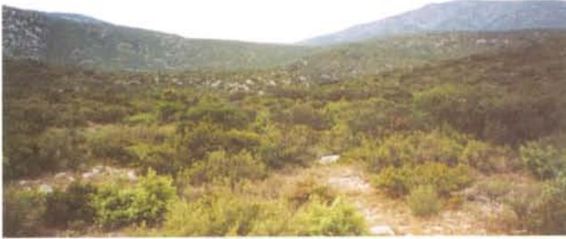
Le site du Souleilla possède un relief valonné

Les zones arbustives sont composées de diverses essences ligneuses méditerranéennes : chêne vert, genévriers... Elles correspondent à des stades intermédiaires vers la reconstitution d'un couvert forestier : fermeture progressive des milieux.