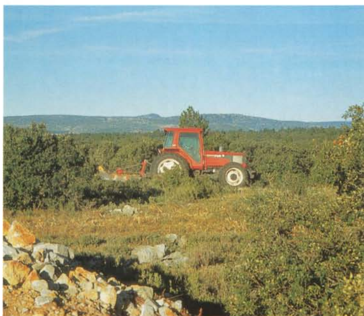
Débroussaillage sur le site de "Garrigue Haute" à Sigean