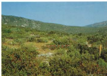
Le balisage sur le terrain a permis de visualiser les zones à préserver.