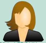
Valérie LEROUX Appui comptable